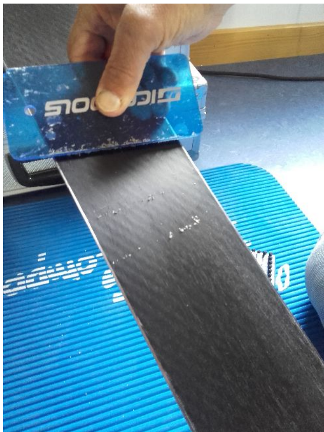
Überschüssigen Wachs abziehen