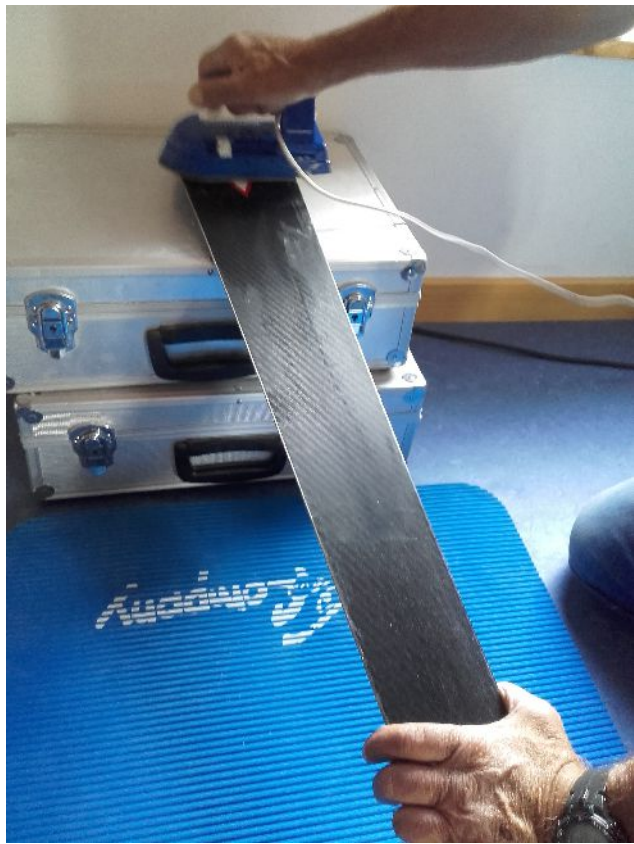
Wachs erhitzen und „Einbügeln“